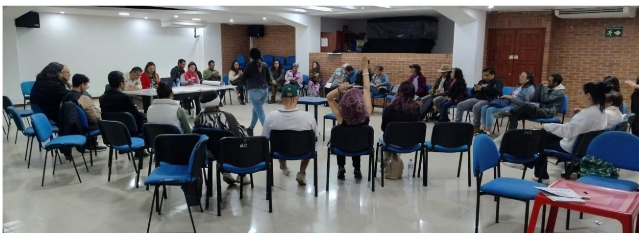
Figura No. 2. Encuentro Ciudadano Tema: Arte, cultura y patrimonio - Salón Azul 04/05/2024.