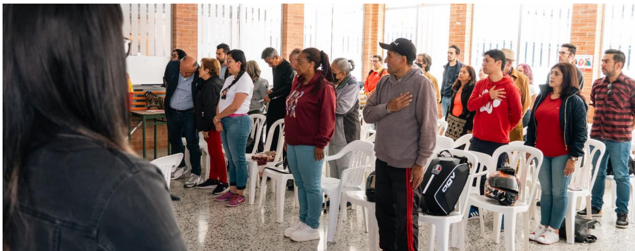
Figura No. 1. Encuentro Ciudadano: Instalación - Colegio Distrital General Santander - Sede AI 13/04/2024.