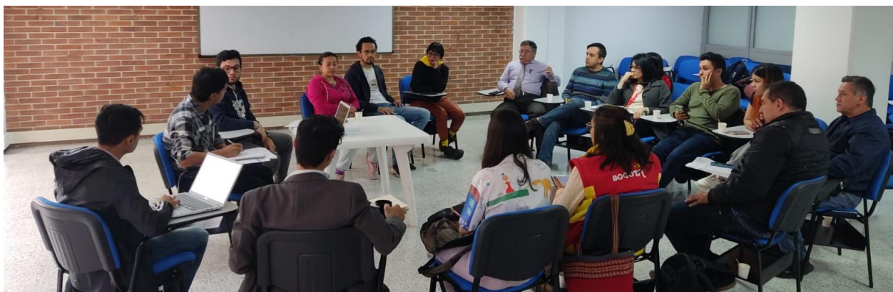
Figura No. 6. Mesa de trabajo sector Ambiente / Hábitat 27/05/2024.

Nota. Tomada por Equipo Participación - Alcaldía Local de Engativá