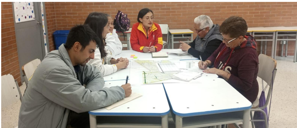
Nota. Mesa Enfoque Poblacional