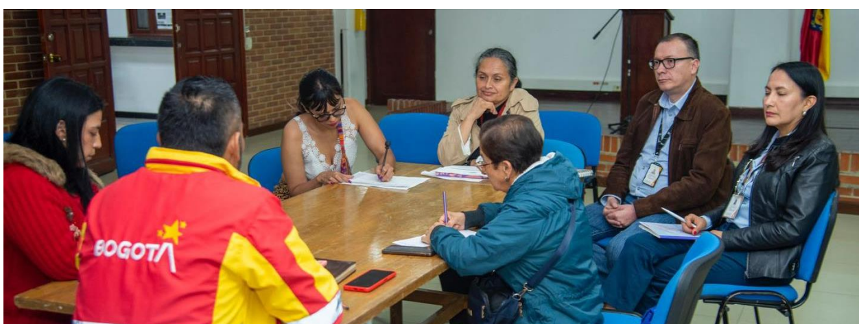
Figura No. 7. Mesa de trabajo sector SDIS / Educación 28/05/2024.

Nota. Tomada por Equipo Prensa - Alcaldía Local de Engativá